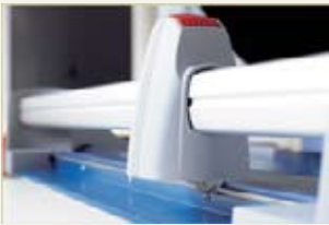
Cirkelmes in kunststof kop