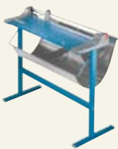
Optionele accessoires 00798 Untergestell