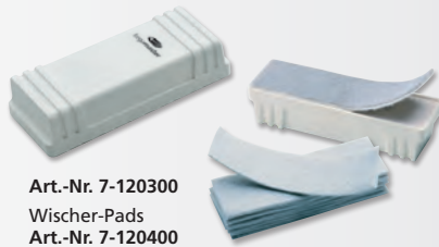
Art.-Nr. 7-120300 Wischer-Pads Art.-Nr. 7-120400