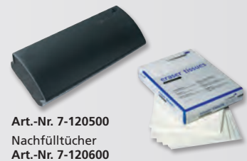
Art.-Nr. 7-120500 Nachfülltücher Art.-Nr. 7-120600