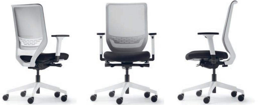
SC 9242/pro white